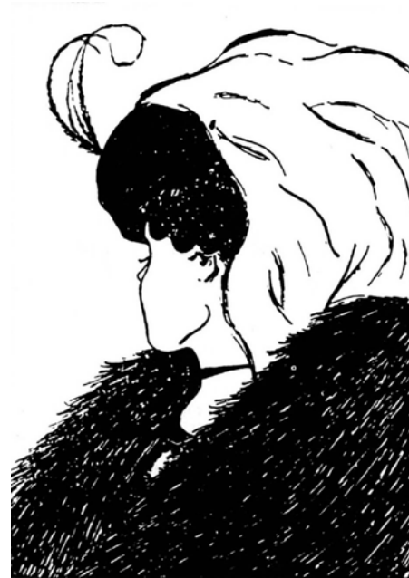
Figuur 1 Meervoudige waarneming.

Ook in de persoonlijke ervaring bij het ontwaken die ik beschreef, doet de wereld zich aan mij voor als een geheel, als dreigend en drukkend, of (na de omslag) als blij en uitnodigend. Onze waarneming levert ons een beeld van de wereld dat het karakter heeft van een 'Gestalt', een samenhangend geheel dat meer is dan de optelsom der afzonderlijke delen (Köhler, 1951). De overgang van het